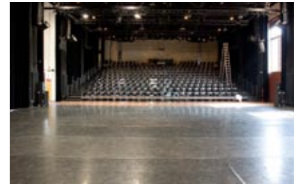
Große Bühne Zuschauerraum

Der Bühne vorgelagert ist das Kachelfoyer mit feinsinniger Originalsubstanz: Spiegel und Seifenschalen zeugen auch noch mehr als 20 Jahre nach Schließung der Zeche vom ursprünglichen Gebrauch der Räume. Die Größe der Bühne bestimmen dabei Sie: denn nicht immer benötigt man die komplette Raumtiefe von 16 Meter ... Die Bühne besitzt eine breite Fensterfront, die bei Bedarf vollständig abgedunkelt werden kann.