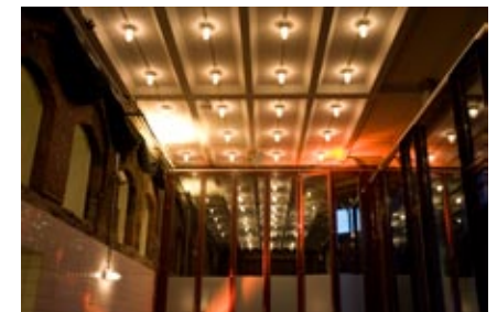
oben recht/links: Foyer unten links: Terrasse unten rechts: Wintergarten